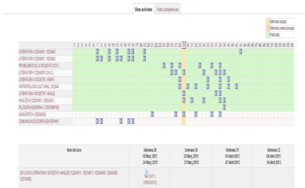
Figura 1. Calendari d'activitats de 1r curs